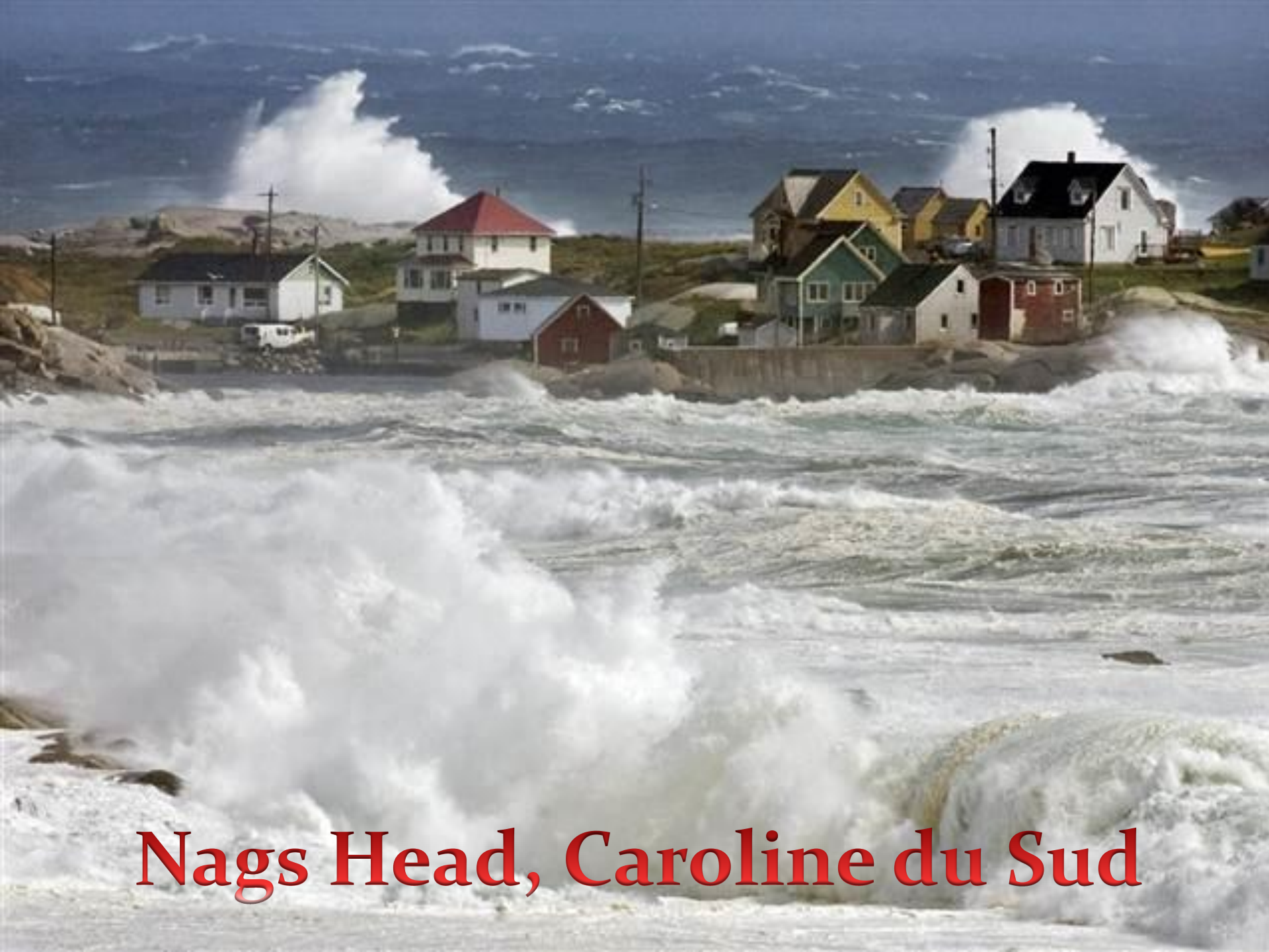
Nags Head, Caroline du Sud